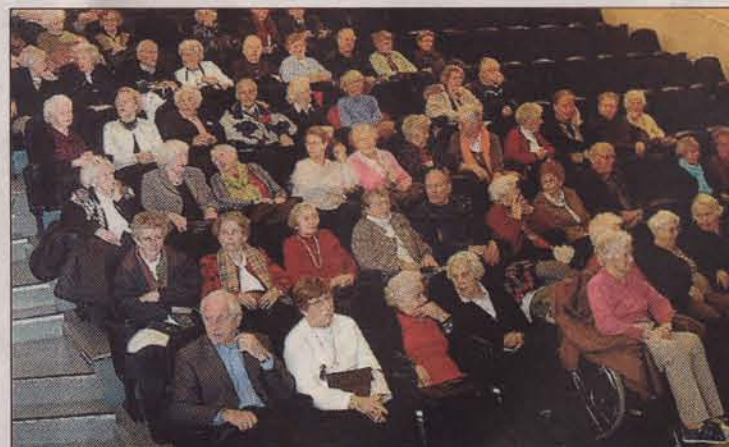
PUBLIKUM: En godt over halvfullt sal koste seg under julekonserten.